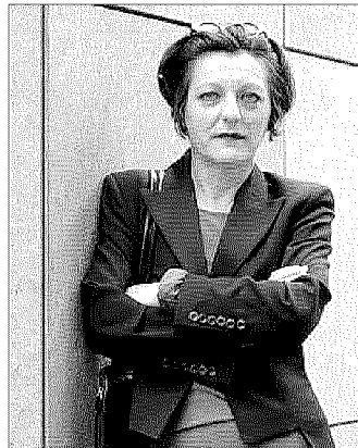
► Herta Müller.