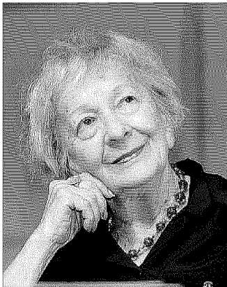
► Wislawa Szymborska.