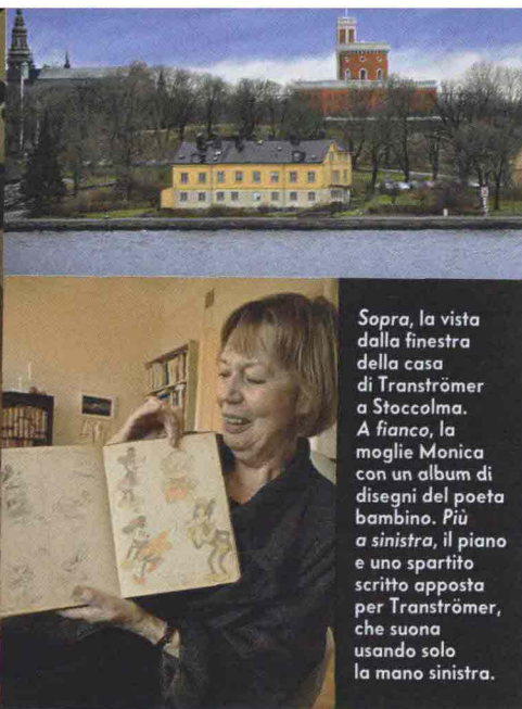
Sopra, la vista dalla finestra della casa di Tranströmer a Stoccolma. A fianco, la moglie Monica con un album di disegni del poeta bambino. Più a sinistra, il piano e uno spartito scritto apposta per Tranströmer, che suona usando solo la mano sinistra.

andavano restituiti il più rapidamente possibile alla società produttiva. Io usavo molto il dialogo. Tutto ha lasciato una traccia nella poesia, come ogni cosa che accade la lascia dentro di noi».