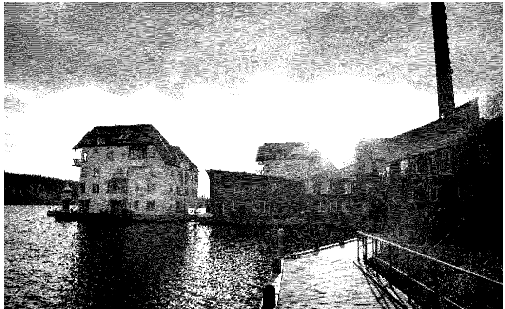
LUCI E OMBRE Nuvole scure su un angolo di Svezia, Paese laboratorio della socialdemocrazia