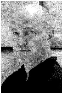
RITRATTO IN NERO Gellert Tamas. Nato nel 1963, giornalista e scrittore svedese di origini ungheresi