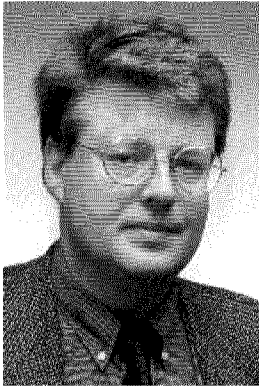
BESTSELLERISTA POSTUMO Stieg Larsson (1954-2004). Il successo dei suoi romanzi giunse dopo la sua morte