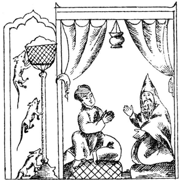
L'uomo si lamenta dei topi con il suo ospite

L'uomo e Zahed presero le monete d'oro e si spartirono il bottino. Zahed mise la sua parte in un sacchetto, che nascose sotto i cuscini. L'avidità mi afferrò di nuovo e decisi di fare un tentativo di recuperare una parte del denaro. Aspettai che Zahed cadesse in un sonno profondo, poi mi avvicinai a lui in punta di piedi, ma l'ospite era sveglio, mi stava aspettando e mi colpì forte con un bastone sulla schiena. Io scappai e, piegato dal dolore, mi infilai nel mio nascondiglio. Ma l'avidità mi afferrò di nuovo. Appena il dolore si calmò, scivolai nuovamente fuori dalla tana e mi avvicinai in punta di piedi ai cuscini di Zahed, ma l'ospite era sempre lì che mi aspettava e questa volta mi colpì così forte che per poco non caddi a terra morto. Raccolgendo le ultime forze, mi trascinai nella mia tana e rimasi lì come un cadavere. Soffrivo così tanto che avrei dato tutto l'oro del mondo perché quel dolore diminuisse un po'. Solo allora mi chiesi perché, se è comunque Dio che ci dà il pane, io dovessi essere così avido. E inoltre: se non possiamo sfuggire alla morte, perché dovevo averne tanta paura? Allora capii ancora meglio come l'avidità ci mette le redini al collo e ci guida. Come un ragazzino che con una corda conduce un grande cammello. È stato così che mi sono arreso. Ho rinunciato all'avidità e ho scelto di accontentarmi. Mi sono rassegnato al mio destino, ho lasciato la casa di Zahed e sono andato a vivere in un prato dove ho fatto amicizia con un colombo di nome