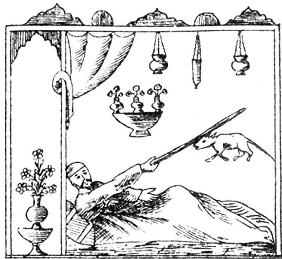
L'ospite picchia il topo

“Ho un'idea”, disse il topo rivolto al cervo, “e credo che sia l'unica soluzione possibile. Prima tu torni dove c'è la trappola, affinché il cacciatore ti veda, ma devi comportarti in modo tale che il cacciatore pensi che sei gravemente ferito e non puoi camminare bene. Poi il corvo si poserà su di te e farà come se