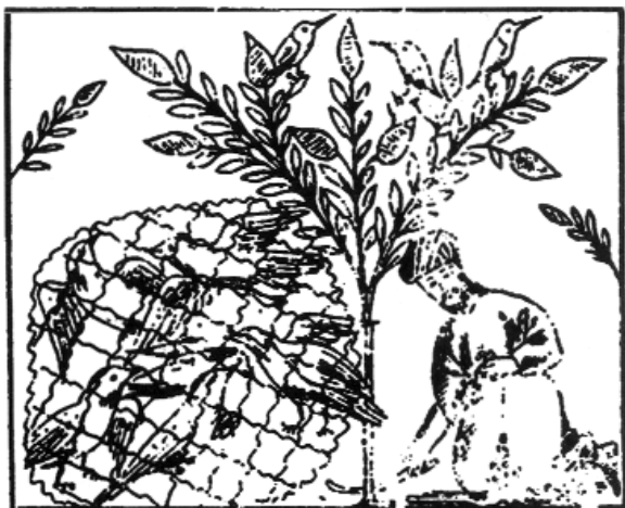
I colombi volano via con la rete