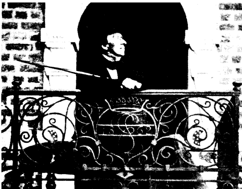
Andersen a Frijsienborg. A destra: découpage di Andersen, museo di Odense