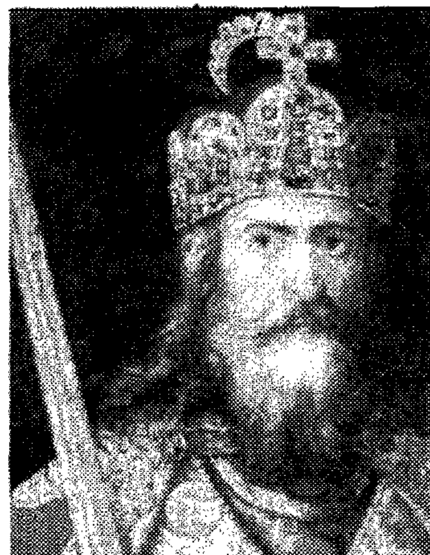
L'imperatore Carlo Magno