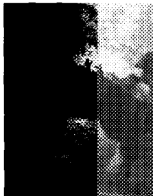
Un'opera in mostra

Non è un caso se il Museo Diocesano dedica una mostra alla pittura di paesaggio. Questa costituisce infatti una delle sezioni più importanti del museo, depositario della collezione del cardinale Giuseppe Pozzobonelli, arcivescovo di Milano dal 1743 al 1783. Da qui, poi, l'idea di ampliare lo sguardo sulla natura. "Luce e paesaggio da Lorrain