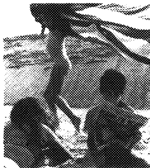
"Wellfleet", Massachusetts, 1962

Robert Frank, svizzero di nascita e americano di adozione, è uno dei grandi personaggi della fotografia mondiale per la sua capacità graffiante di usare l'immagine in modo asciutto, lineare, cattivo, scardinando le convenzioni come fece nel 1958 con "The Americans", un reportage che distruggeva la retorica dell'american way of life. Questa sua personale dal titolo "Lo straniero americano", organizzata da Palazzo Reale e dal 24 Ore Motta Cultura, raccoglie ottanta fotografie in bianco e nero e alcuni lungometraggi d'artista da lui realizzati per il circuito underground. A Palazzo Reale dal 14 ottobre al 18 gennaio.